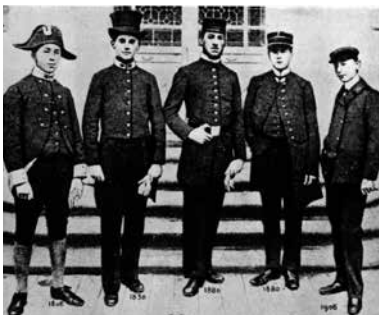
Uniforme des collégiens de 1806 à 1906

Un siècle plus tard, le collège parvient à la consécration en 1682 : le Roi-Soleil lui accorde son patronage officiel. Il reçoit alors le nom de Collegium Ludovici Magni, "Collège de Louis-le-Grand". Il dispense désormais un enseignement prestigieux et réputé à plus de trois milles élèves, dont cinq cents pensionnaires.