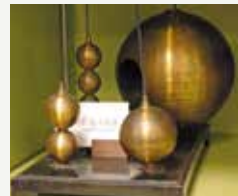
Résonateur de Helmholtz Fonds du Musée Scientifique du lycée Louis-le-Grand

Pour connaître notre calendrier annuel, consultez le en ligne sur www.peepllg.fr