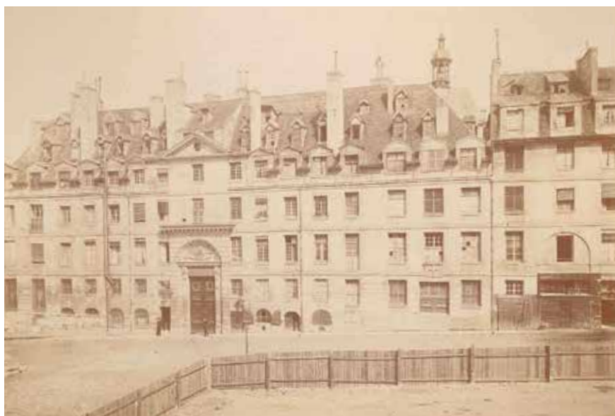
Façade du lycée avant la reconstruction de 1885, reproduction d'une vue de Pierre Petit, vers 1860

Le lycée Louis-le-Grand apporte une attention particulière à la préparation de l'oral des concours, en organisant pour les élèves de ECG1 et de ECG2, une journée de simulation d'entretiens.